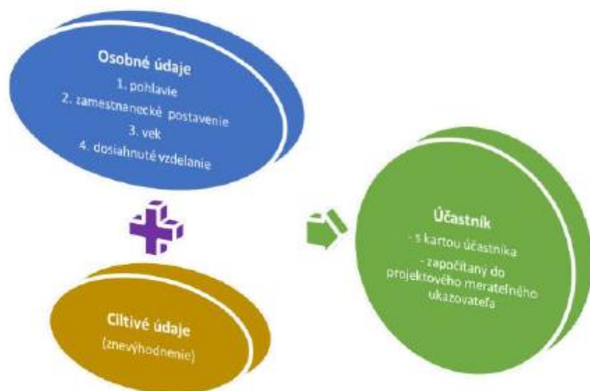
Modelová situácia 1